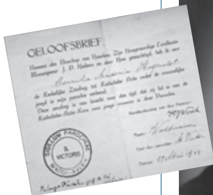
Links: Corry's geloofsbrief voor de Katholieke Actie. Rechts: Bisschop van Haarlem Monseigneur J.P. Huibers.