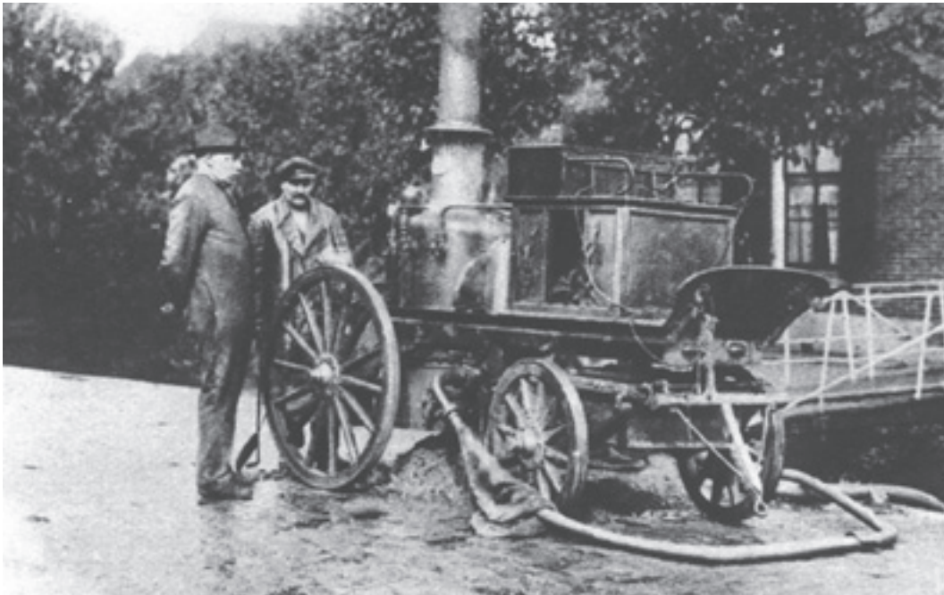
Links: De Waddinxveense brandweer voor de ruïne. Onder: De verwoesting na de brand in 1926.