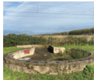
Betonnen fundament van een Duitse luchtafweerstelling aan de Vijfde Tochtweg in Moerkapelle (spoorweg uit Waddinxveen komt daar samen met die uit Den Haag).