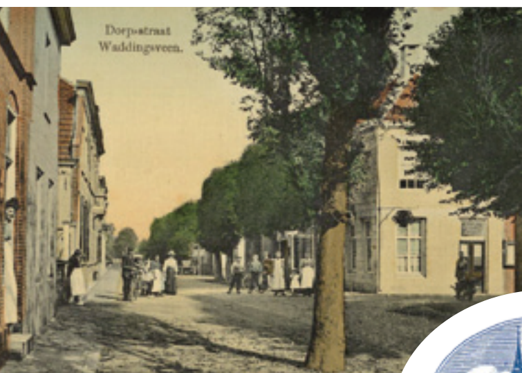
Het oude dorp