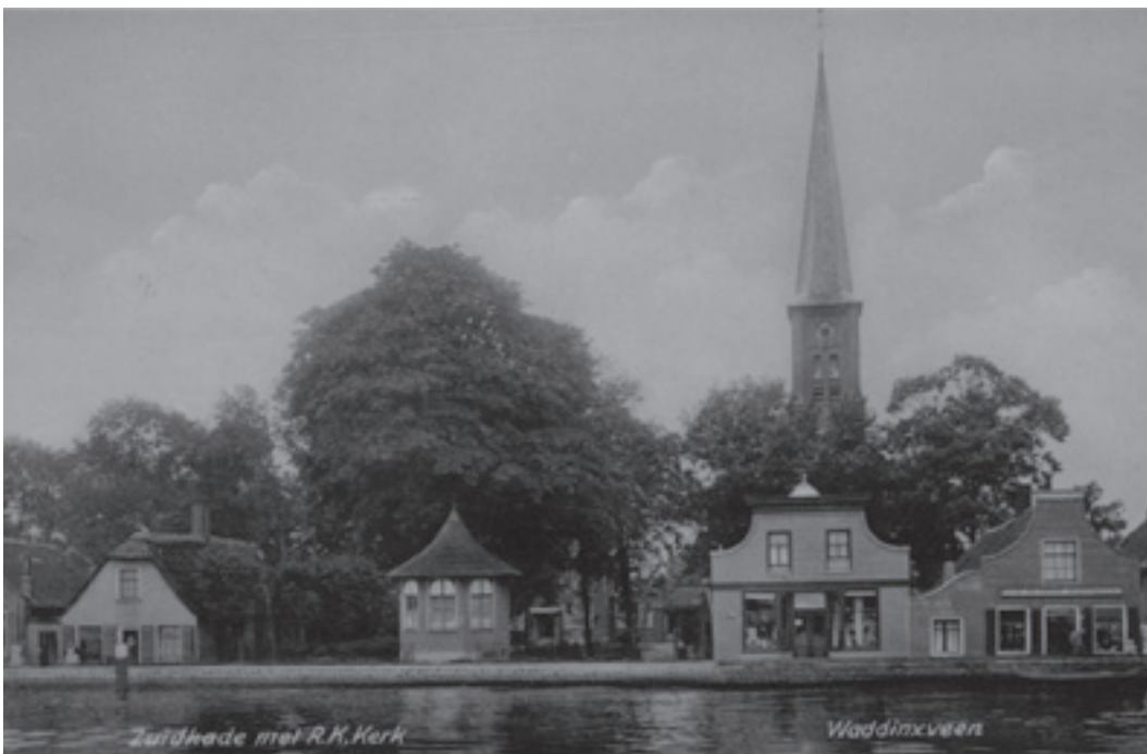
De Zuidkade met de R.K. kerk te Waddinxveen gezien vanaf de overkant van de Gouwe ca 1930.