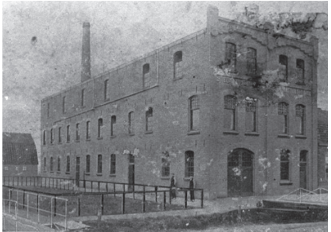
Stenen fabriek tussen 1907 en 1926.