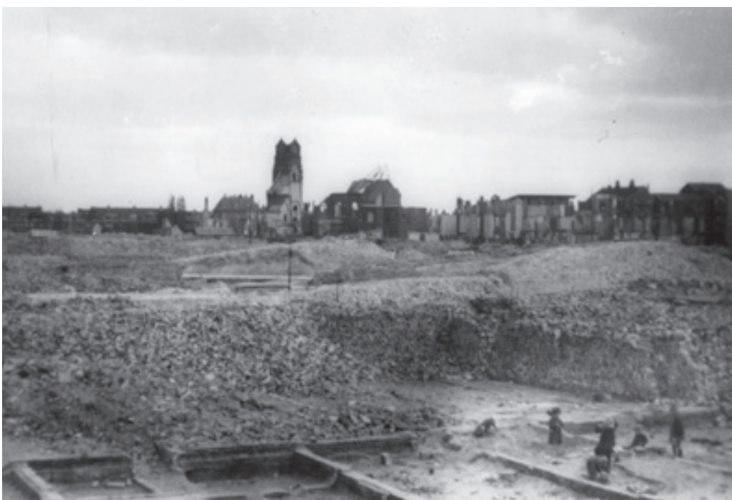
Bezuidenhout, verwoesting gezien vanuit een woning aan de 1e Van den Boschstraat.