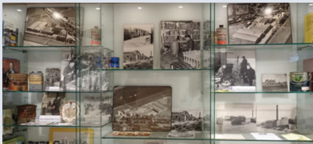
Een deel van de expositie.

De expositie is de hele winter te bezichtigen in onze vitrines in Cultuurhuys De Kroon op de eerste etage tegenover de balie van bibliotheek.