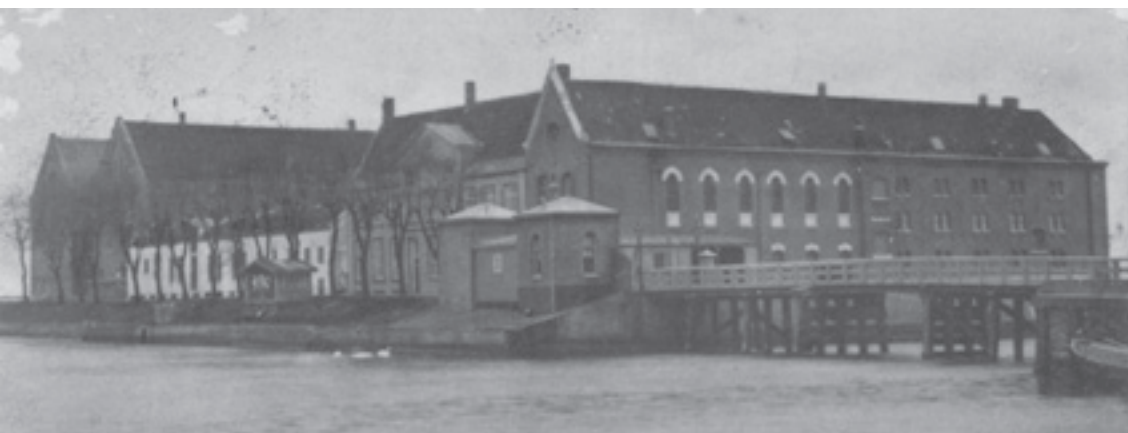
Het Huis van Correctie in Hoorn werd op 1 september 1886 officieel opgeheven. Daarna werd het Oostereilandcomplex bestemd als Rijkswerkinrichting waar aanvankelijk recidivisten en disciplinair gestraften uit Veenhuizen geplaatst werden. Na twee jaar werden er ook dronkaards, bedelaars, landlopers en later ook souteneurs opgenomen. Deze instelling werd in 1933 opgeheven. Bron: Vereniging Oud Hoorn

In 1909 is de 55-jarige Cornelis vrij man. Hij gaat naar Den Haag waar hij verblijft bij het Leger des Heils aan de Wagenstraat of in logementen zoals de Korf des Gods of één van de andere logementen aan de Ammunitiehaven. De logementen zijn vies en de bedden slecht. Cornelis verblijft van 1915 tot 1917 in het Stedelijk Armenhuis aan de Roeterstraat 2 te Amsterdam en gaat vervolgens naar het Bestedelingenhuis aan het Westeinde. Daar overlijdt hij op 7 november 1921, zevenenzestig jaar oud. <