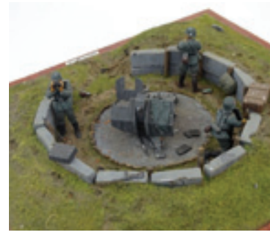
Diorama van een Duitse luchtafweerstelling.